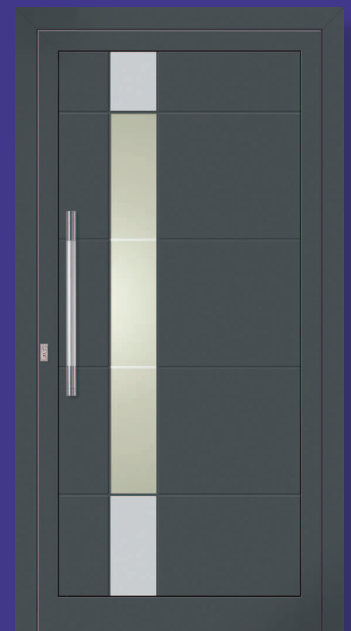
Cia links Iso-Glas mit Sandstrahlung „Cia 2“ (Fläche klar - Linien matt), silber-eloxierte Alu-Applikationen