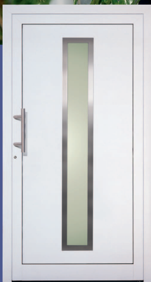
Zento Iso-Glas klar